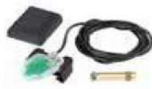
SAFEcoder (codificador absoluto magnético BUS) para actuador 412 (patente FAAC) 404041