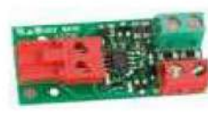
Interfaz BUS XIB (para tarjeta E045 o E024S con fotocélula no BUS) 790062