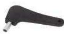
Par de llaves de desbloqueo adicionales 713009